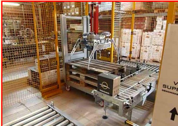
Dispositivo di prelievo bancali da carrello porta pallet vuoti