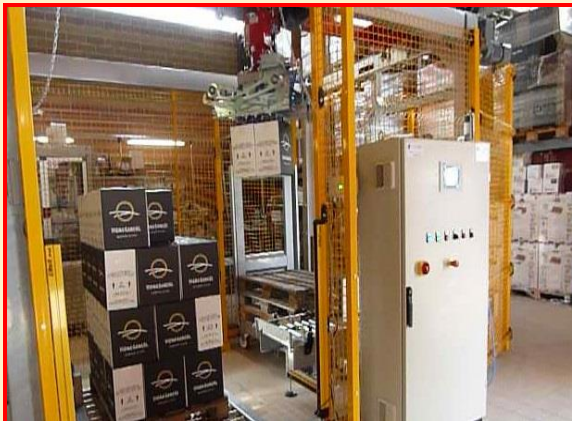
Organo di presa per prelievo singola e doppia scatola