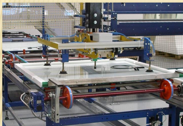
Organo di presa multiplo