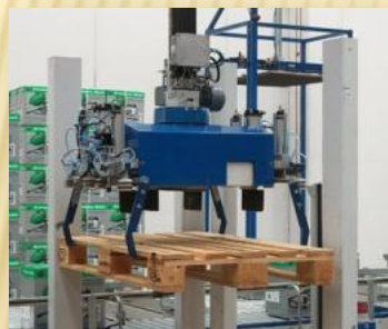
Organo di presa pallet

L'esclusivo software permette tramite interfaccia macchina/operatore (monitor a colori touchscreen in ambiente windows) di configurare autonomamente e con estrema semplicità i programmi di pallettizzazione, personalizzare il ciclo di lavoro e visualizzare con facilità, in tempo reale, i parametri relativi al funzionamento del robot (diagnostica, allarmi, ecc.). È possibile scambiare dati con Host computer aziendali . Ats engeenirig offre anche il servizio di teleassistenza .