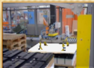
Organo di presa cartone di interfalda o foglio di polistirolo